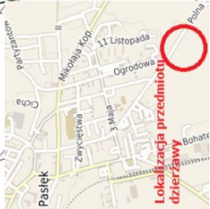
Lokalizacja przedmiotu dzierżawy