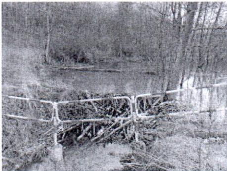
IMG_20200331_135555.jpg ~8,7 MB