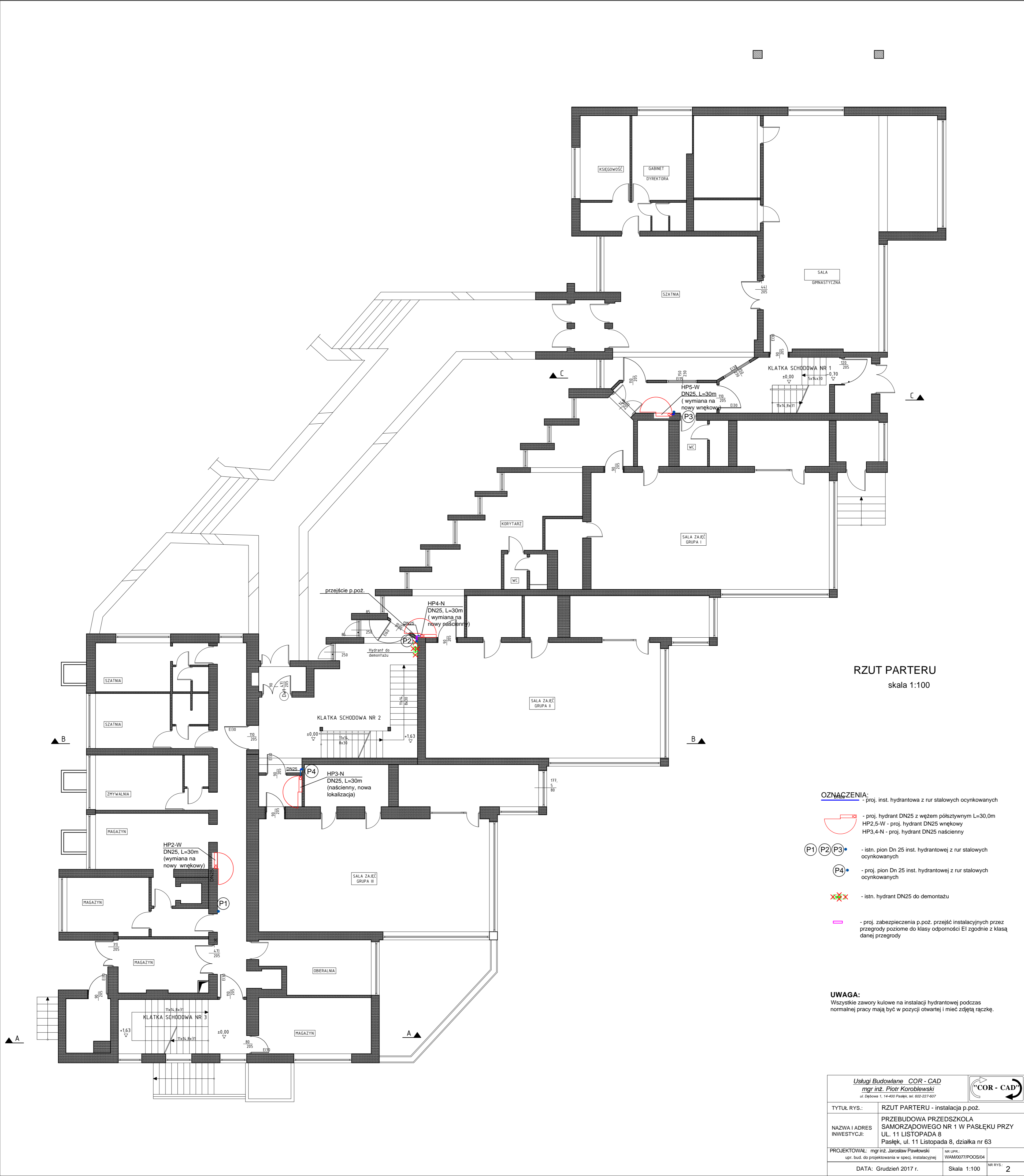
RZUT PARTERU skala 1:100