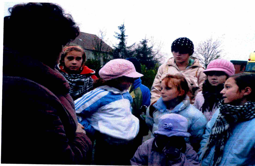
Dorośli mieszkańcy oraz dzieci i młodzież z Sakówka i Pólka dyskutują o koniecznych w ich miejscowościach zmianach i potrzebach