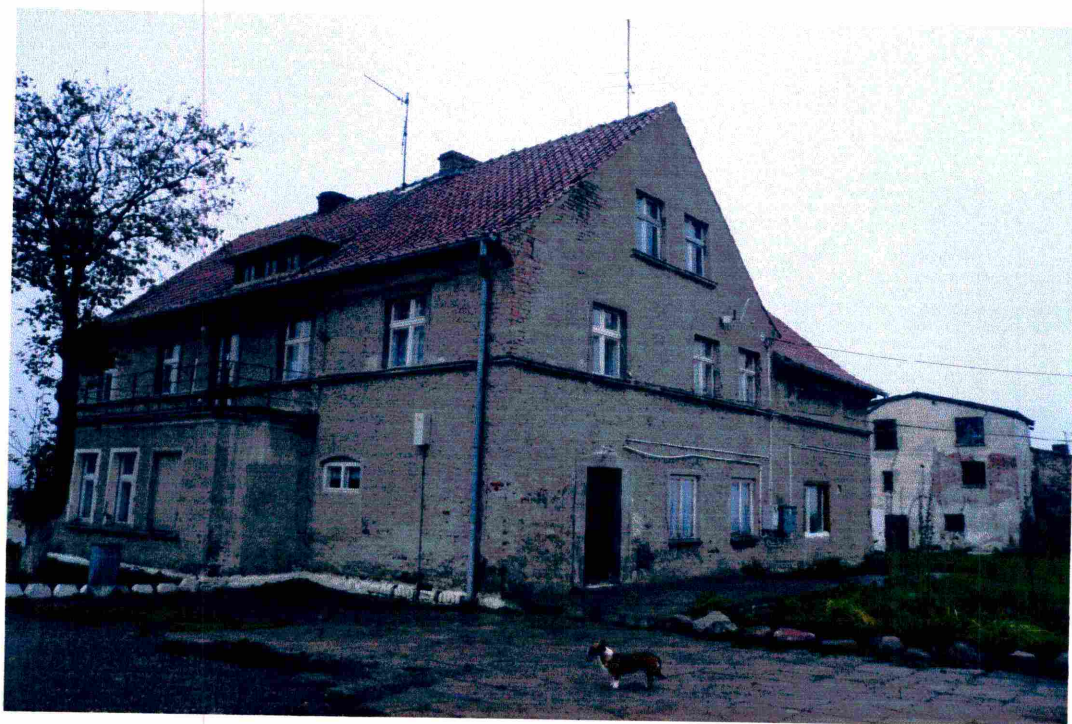
Zaniedbane budynki gospodarcze